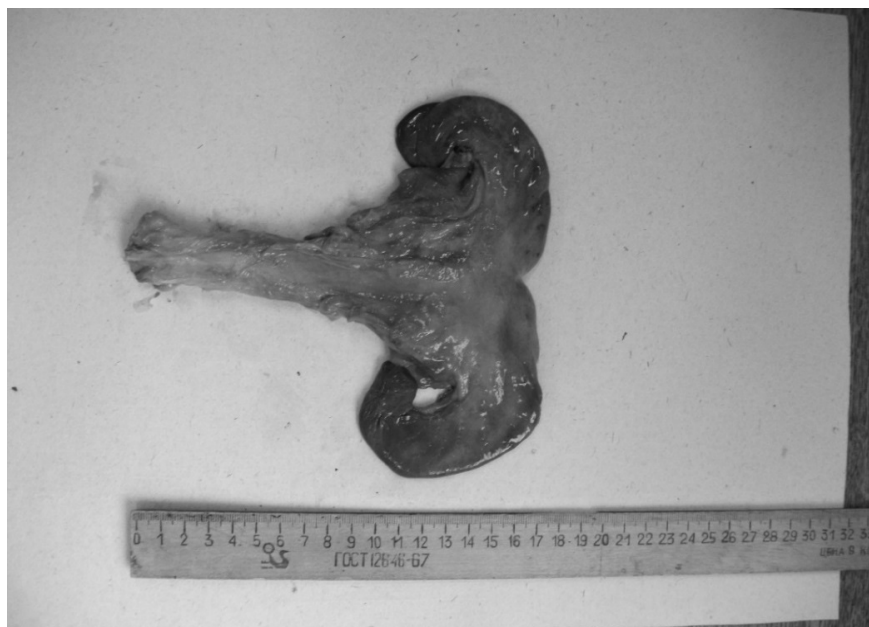
Рис. 1. Матка кіз зааненської породи

Висновки. В результаті проведених досліджень дана анатомічна і морфометрична характеристики внутрішніх статевих органів кіз. Ці дані дають змогу розширити і доповнити знання з морфології статевої системи сільськогосподарських тварин, що потрібно враховувати при штучному осіменінні кіз. Отримані нами дані дещо відрізняються від результатів досліджень інших авторів, але не суперечать їм.